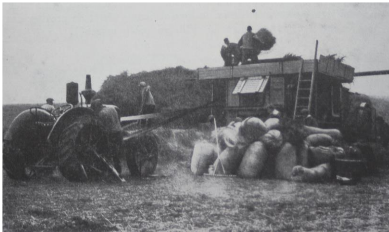
Figure 1:

Les machines à battre ou batteuses sont complexes. La finesse et la complétude des réglages, le nombre de tamis et de systèmes de ventilation influençaient le prix et la puissance motrice nécessaire.