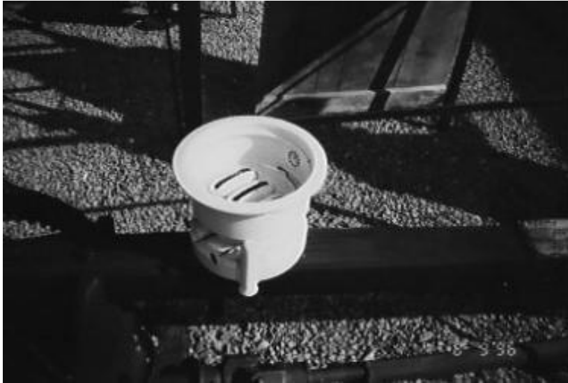
Musée de la vie rurale de Huissignies : réchaud d'infirmière.

Musée de la Vie Rurale 28, rue Augustin Melsens 7950 Huissignies – Chièvres musee.vierurale@skynet.be www.musee-huissignies.com