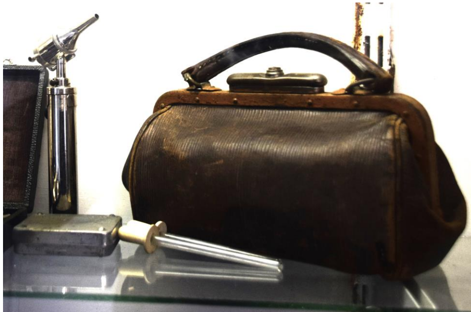
Pharmacie du Musée de la vie rurale Huissignies

Dans les cas graves, on appelait « en consultation » c'est-à-dire deux Docteurs. Bien souvent (et au mieux !) cela se terminait par une opération. Les honoraires étaient fréquemment réglés à l'année.